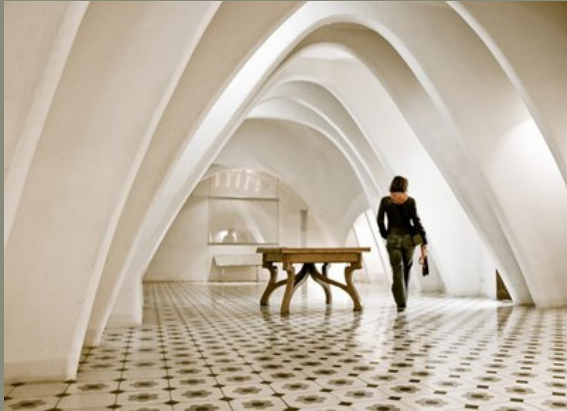
El desván de la Casa Batlló